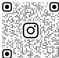
観音寺子ども食堂